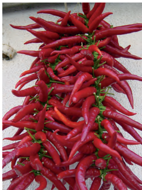
fotoPic 2007 di Enzo Caselli