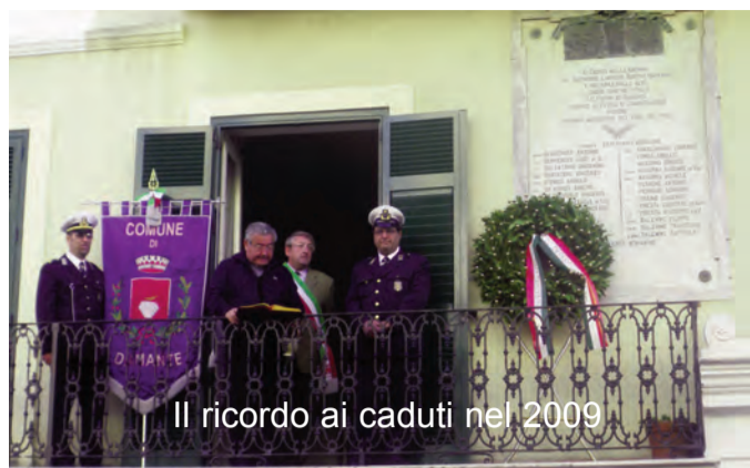
Il ricordo ai caduti nel 2009

Solo consolidando i valori che ci accomunano e ci rendono italiani che possiamo aspirare ad essere compiutamente cittadini europei. Come ha scritto, infatti, il nostro Presidente, Giorgio Napolitano: "E' solo rafforzando